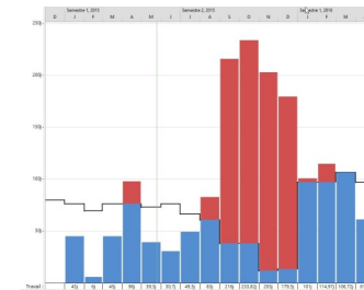
Graphe de capacité de travail

E-Labor Conseil est une SAS de cinq intervenants senior expérimentés : trois ingénieurs planning, un ingénieur risque et un ingénieur gestion documentaire. Un ingénieur d'étude sédentaire complète l'équipe et assure l'assistance à distance.